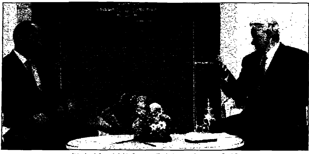
الرئيس الروسي بوريس يلتسين يستقبل نيكولاي كيريونكو في موسكو (دويتشه)

موسكو - من جاريث جونز: الروسية الجديدة - الرئيس الروسي بوريس يلتسين قد أعلن رسمياً عن تشكيل حكومته الجديدة، وهو خطوة تاريخية في مسيرة الديمقراطية في روسيا. يلتسين، الذي تم انتخابه في الانتخابات الرئاسية عام 1996، يواجه تحديات كبيرة في تشكيل حكومة قادرة على معالجة المشاكل الاقتصادية والاجتماعية التي تواجهها روسيا. الحكومة الجديدة، التي يرأسها سيرغي سيبيرغ، تضم أعضاء من مختلف الأحزاب السياسية، مما يعكس تنوعاً سياسياً غير مسبوق في تاريخ روسيا الحديث. يلتسين أكد في خطابته الأولى أمام البرلمان أن حكومته الجديدة ستعمل على تعزيز الديمقراطية وحقوق الإنسان، وكذلك معالجة المشاكل الاقتصادية التي تسببت في انهيار الاقتصاد الروسي خلال السنوات القليلة الماضية. الحكومة الجديدة ستواجه تحديات كبيرة في معالجة التضخم والبطالة، وكذلك إصلاح النظام القضائي والبيروقراطية. يلتسين أكد أنه سيعمل على تعزيز الديمقراطية وحقوق الإنسان، وكذلك معالجة المشاكل الاقتصادية التي تسببت في انهيار الاقتصاد الروسي خلال السنوات القليلة الماضية.